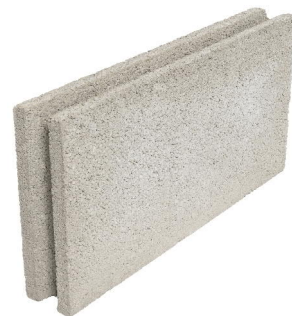
Aukonylitysharkko (alapinta) 88x299x598 mm