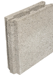
Puolikas harkko 88x299x298 mm