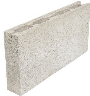
Päätyharkko 88x299x598 mm