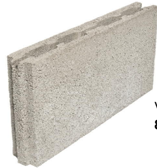
VSH-88/600 88x299x598 mm